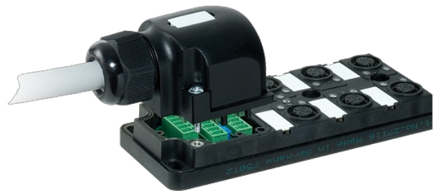
M12 Females 5-pole