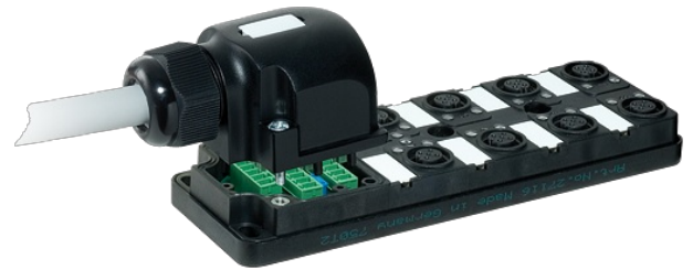
M12 Females 5-pole