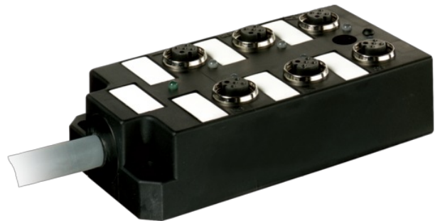
M12 Females 4-pole