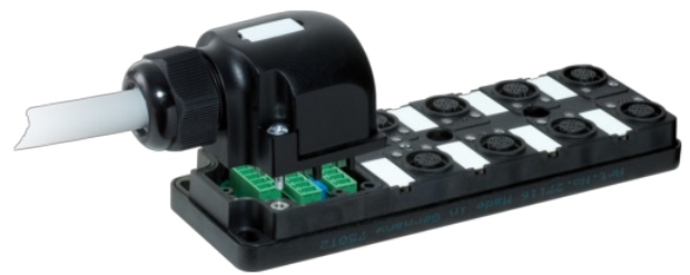
M12 Females 5-pole